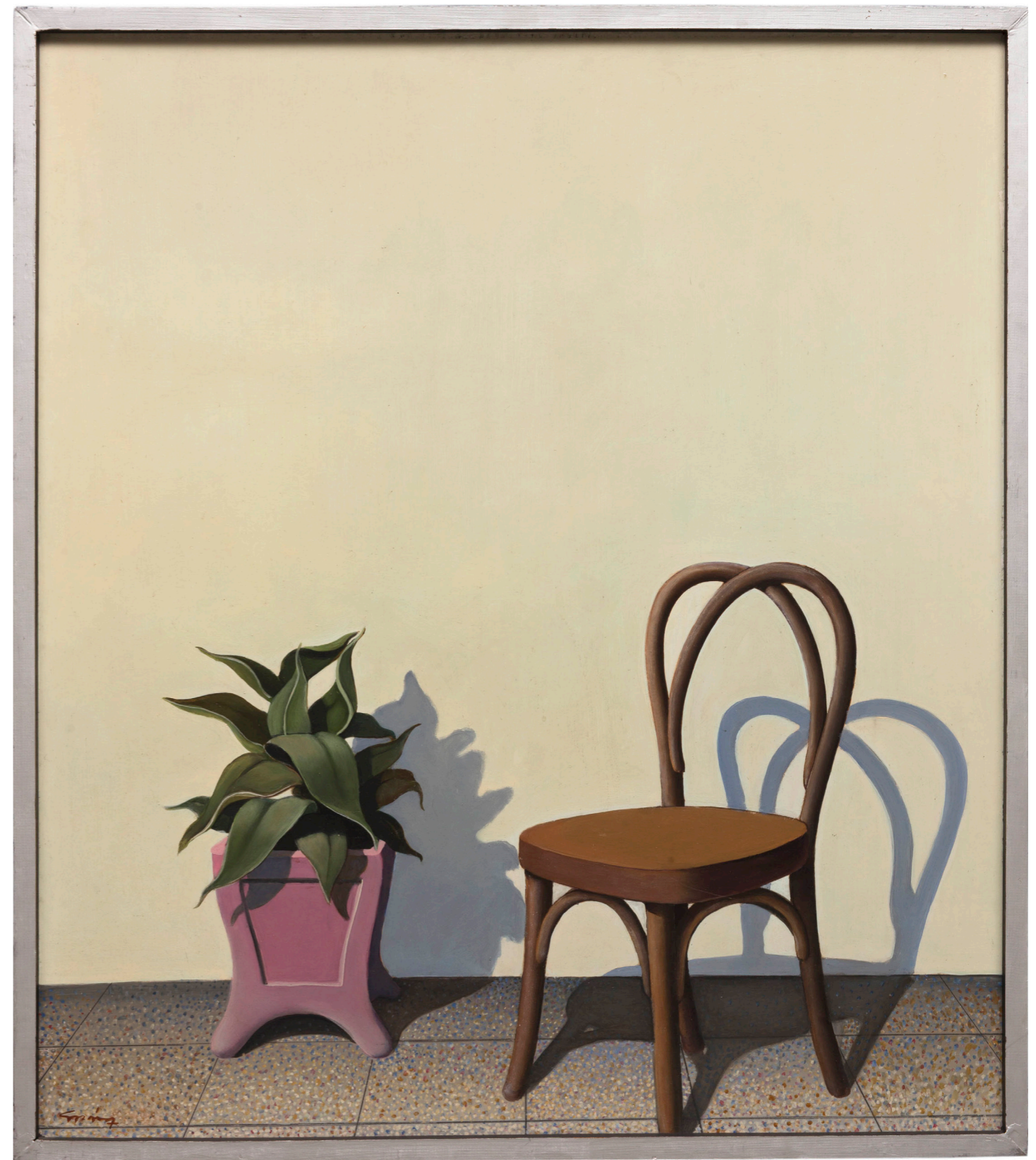
Pablo Suárez Patio 1978 Óleo sobre panel 103 x 91 cm Museo de Arte Moderno de Buenos Aires