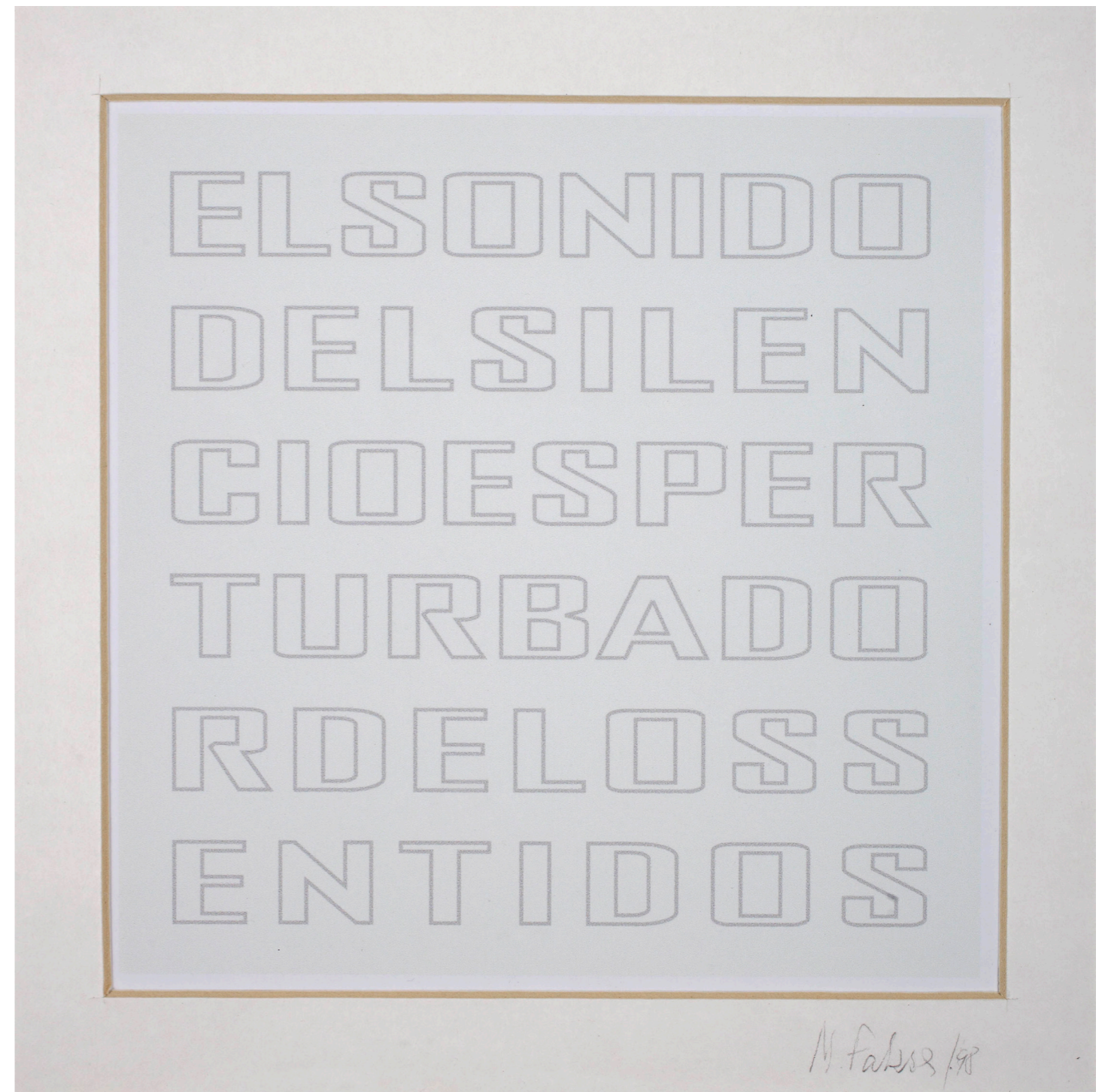
Margarita Paksa El sonido del silencio es perturbador de los sentidos 1998 Lápiz sobre papel 40 x 40 cm Museo de Arte Moderno de Buenos Aires