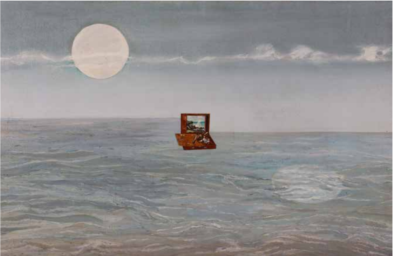
Álbum de memorias I. El reflejo de la luna sobre el agua, 1998. acrílico y transferencias sobre tela. 80 x 120 cm. Colección de la artista

Observá atentamente esta imagen durante 10 segundos; prestá mucha atención a los detalles.