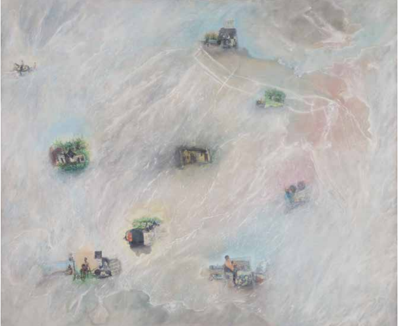
Álbum de memorias IV , 1999. Acrílico y transferencias sobre tela. 150 x 180 cm. Colección Museo Nacional de Bellas Artes

Elda Cerrato realizó varias pinturas a las que tituló "Álbum de memorias". Aquí te compartimos una de ellas: