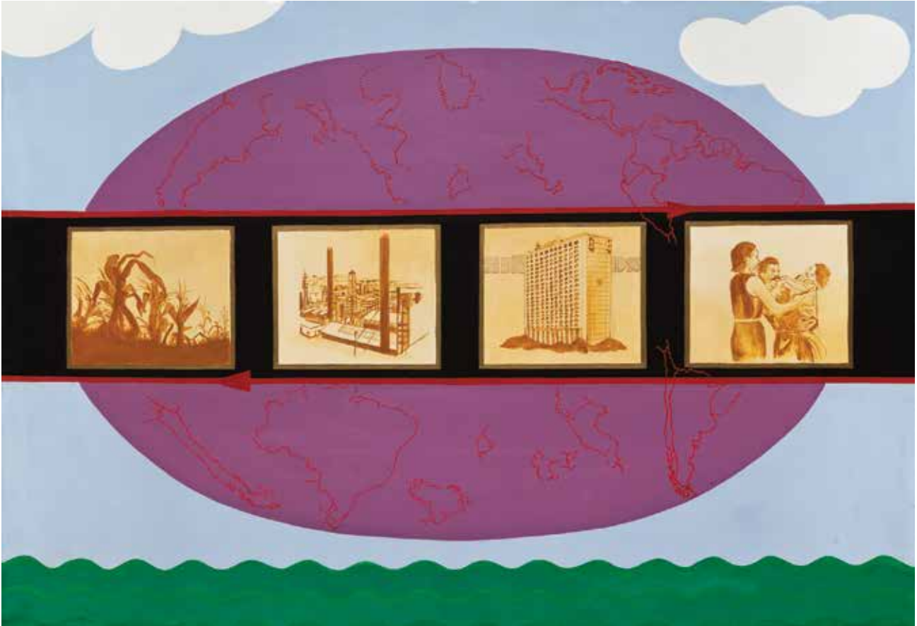
Repertorio de los sueños III , de la serie "De la realidad", 1974. Acrílico sobre tela. 66 x 96 cm. Colección de la artista

Un repertorio es un conjunto, una colección.